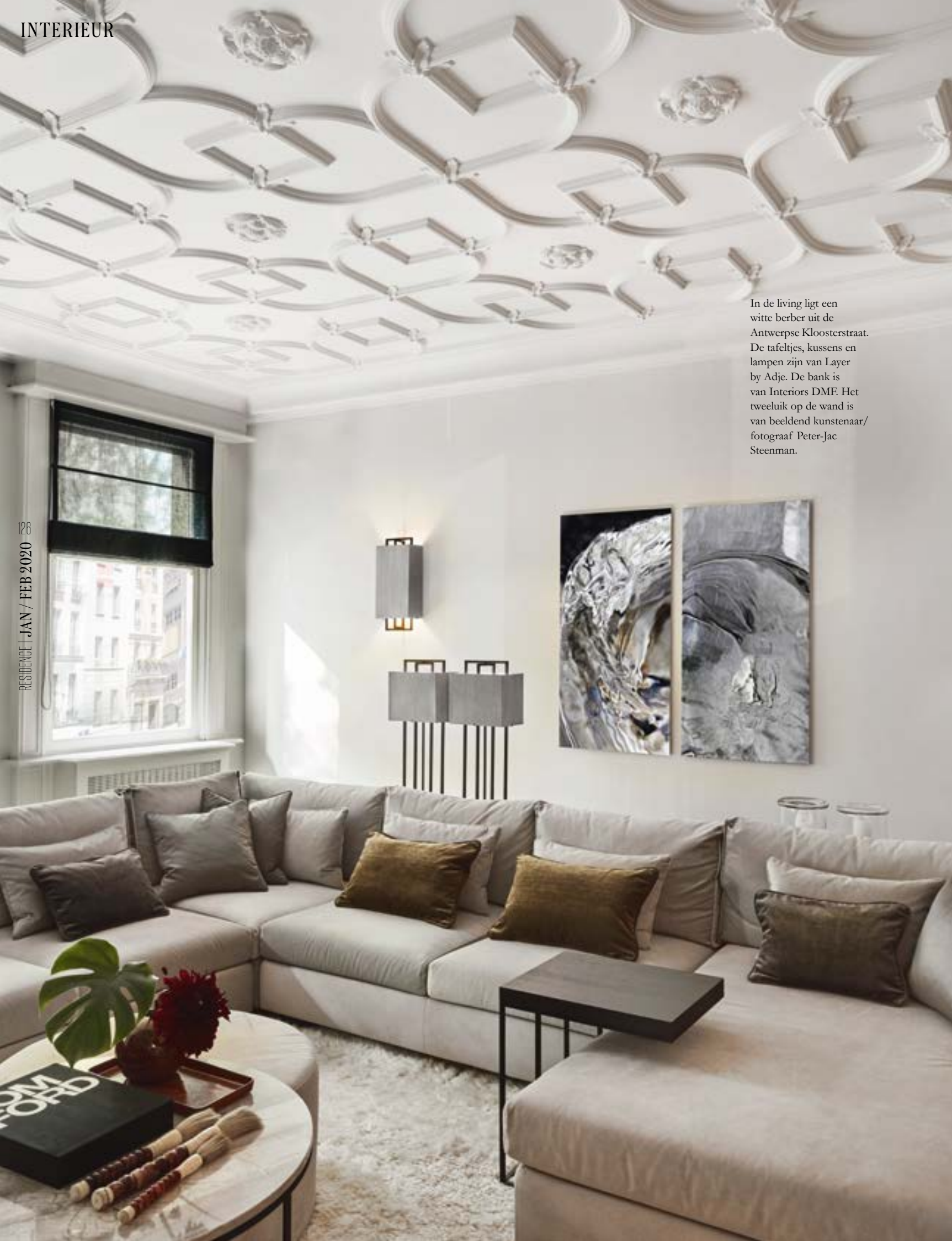
In de living ligt een witte berber uit de Antwerpse Kloosterstraat. De tafeltjes, kussens en lampen zijn van Layer by Adje. De bank is van Interiors DMF. Het tweelুক op de wand is van beeldend kunstenaar/fotograaf Peter-Jac Steenman.