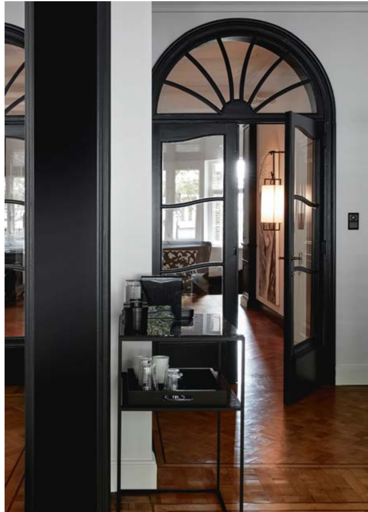
Doorkijkje naar de gastensuite op de tweede verdieping, met de lamp Oman van Layer by Adje.