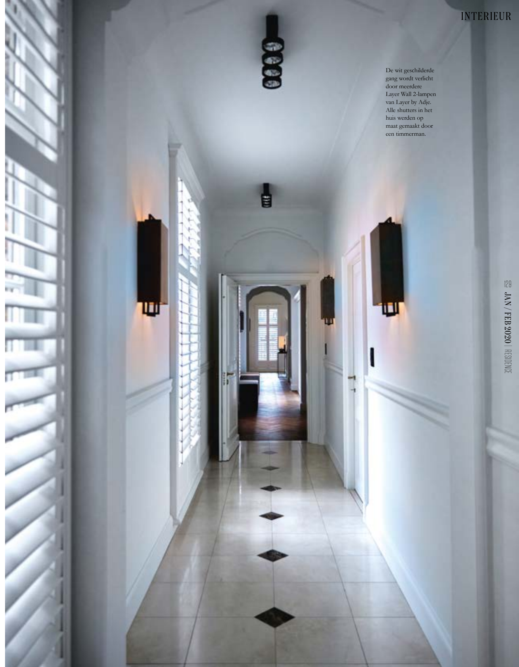
De wit geschilderde gang wordt verlicht door meerdere Layer Wall 2-lampen van Layer by Adje. Alle shutters in het huis werden op maat gemaakt door een timmerman.

trappenhal met imposante houten trap uit de kerk van Lier waren de charmante pijlers waar ik omheen moest werken. Op het moment van aankoop was het huis een tikje gedateerd, maar de basis was goed. De bewoners wilden dat ik er een eigentijdse woning van zou maken. Ik dacht toen gelijk aan Adje Verhoeven, de ontwerper met wie ik al verschillende projecten samen heb gedaan. Zijn lampen zijn legendarisch: tijdloos en toch modern. Hij maakt ze in elke denkbare vorm en samenstelling van materialen. Toen ik hem belde om mee te denken over dit huis was hij gelijk geïnteresseerd. En toen hij het pand zag was hij nóg enthousiaster. We hebben uiteindelijk samen het hele huis ingericht, natuurlijk met allemaal custommade lampen van Adje, maar ook met verschillende items uit zijn interieur- en meubelcollectie, zoals verschillende kleine meubels, spiegels en kussens. Het was erg fijn en verfrissend om met hem te sparren.' ▶